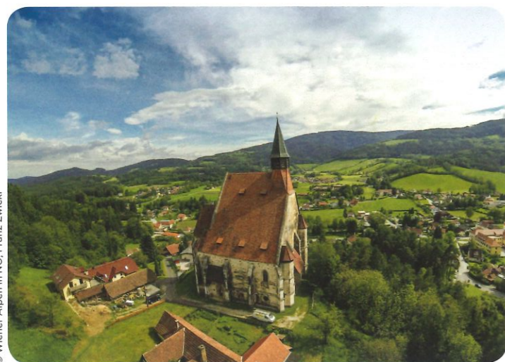
Kirchberg am Wechsel

Der Radweg im Feistritztal ist einer der Kleinode unter den neuen Radwegen in den Wiener Alpen in Niederösterreich. Mit ca. 18 Kilometern ist er ein kurzer Radweg, hier bleibt aber mehr Zeit zum Genießen der Talidylle an der Feistritz. Vom Eurovelo 9 bei Aspang führt der Radweg eben mit zwei kleinen Zwischensteigungen durch Feistritz und Kirchberg nach Otterthal bis kurz vor Trattenbach, wo der Philosoph Ludwig Wittgenstein als Volksschullehrer gewirkt hat.